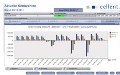
QlikView Applikation für ERP-Systeme der Wohnungswirtschaft

Hohe Kompetenz beweist cellent nicht nur im SAP®-Umfeld sondern auch bezüglich der Anbindung des Quasi-Standard ERP-Systeme der Wohnungswirtschaft Wodis und Wodis Sigma: Speziell für Nutzer dieser Systeme hat die Mittelstandsberatung spezifische QlikView Applikationen, beispielsweise für die Analyse von Mietbuchhaltungen, entwickelt. Eingesetzt werden diese unter anderem von der GRWS Wohnungsbau- und Sanierungsgesellschaft der Stadt Rosenheim.